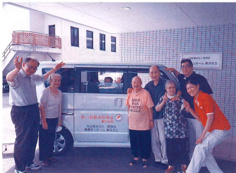
高齢者施設に車両を整備しました ～買物や散歩の外出行事に大活躍です～