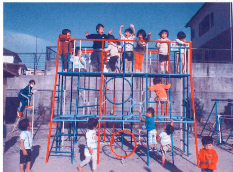
保育施設にジャングル登降棒を設置しました ～元気いっぱい遊んでいます～

令和2年度に引き続き、令和3年度共同募金運動に先立ち「赤い羽根新型コロナ感染下の福祉活動応援全国キャンペーン いのちをつなぐ支援活動を応援!～支える人を支えよう～」を実施しました。