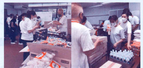
留学生の生活を支えることができました

新型コロナウイルス感染拡大に起因した困りごとを抱えた人たちの生活課題に対して、課題解決に取り組む団体の活動を支援することを目的とし、20件 2,809,104円の助成を行いました。